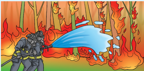
Bomba bertugas memadamkan kebakaran hutan