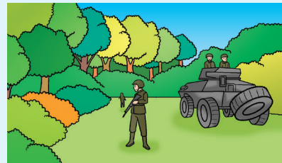
Tentera bertugas mengawal sempadan negara