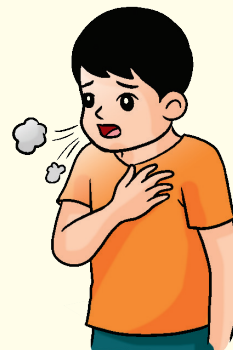
Kadar pernafasan bertambah