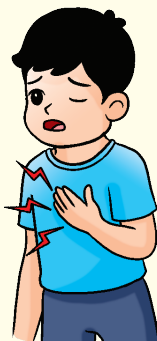
Denyutan jantung bertambah