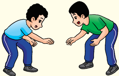
Permainan Tampar Lutut